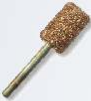
RF-3 Zylinder 11 mm Art.-Nr. 219778 grobe Körnung Art.-Nr. 219779 feine Körnung