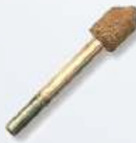
Art.-Nr. 219790 RF-9 kleiner Spitzsenker 90° 7 mm ultrafeine Körnung