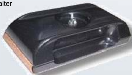
Art.-Nr. 219768-SH-Holder Schleifpapierhalter