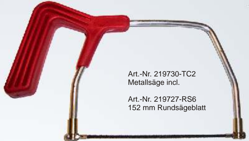
Art.-Nr. 219730-TC2 Metallsäge incl.