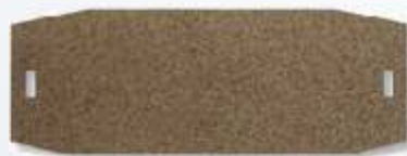
Art.-Nr. 219773-SH120XXC Schleifblatt sehr grob