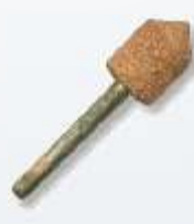
RF-10 großer Spitzsenker 90° 10 mm Art.-Nr. 219791 feine Körnung Art.-Nr. 219823 ultrafeine Körnung