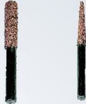
Art.-Nr. 219749 LR1C Stift 8 mm grobe Körnung

PERMAGRIT Schleifstifte werden mit einem 6 mm Schaft geliefert und sind ausschließlich in den angegebenen Körnungen erhältlich. Alle Schleifstifte können mit Mini-Bohrmaschinen (wie Dremel od. ähnliche) bei max. 20.000 U/min. eingesetzt werden.