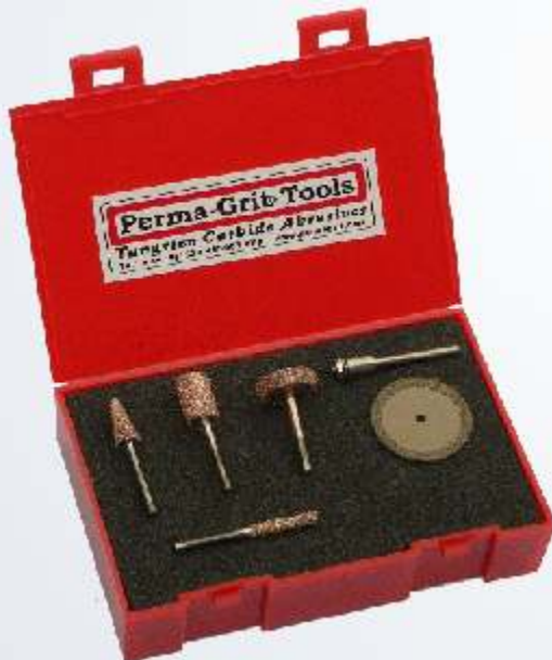
Art.-Nr. 219822-KT5 Satz Schleifstifte mit Trennscheibe RF-1C, RF-3C, RF-4C, RF-6C & RD2 32 mm