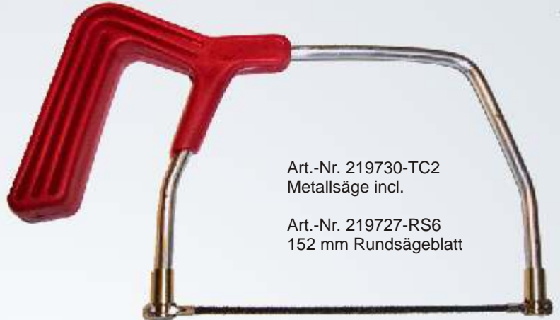
Art.-Nr. 219730-TC2 Metallsäge incl.

Die Hartmetall Sägeblätter, ermöglichen in jede Richtung Winkel und Formen zu schneiden. Stark aber einfach in der Handhabung. Für alle Oberflächenmaterialien geeignet unter anderem für Keramik geeignet.