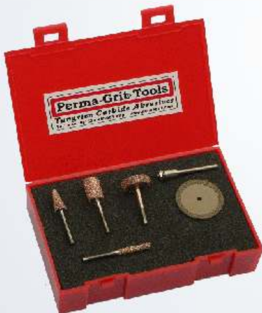
Art.-Nr. 219822-KT5 Satz Schleifstifte mit Trennscheibe RF-1C, RF-3C, RF-4C, RF-6C & RD2 32 mm