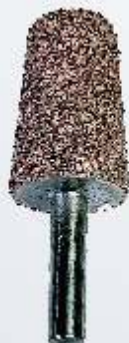
Art.-Nr. 219754 LR6C großer Kegel 20 mm grobe Körnung