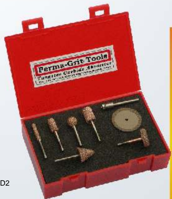
Art.-Nr. 219821-KT1 Satz Schleifstifte mit Trennscheibe RF-2C, RF-3C, RF-4C, RF-5C, RF-6C, RF-8C & RD2 32 mm