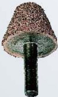
Art.-Nr. 219753 LR5C Konus 26 mm grobe Körnung