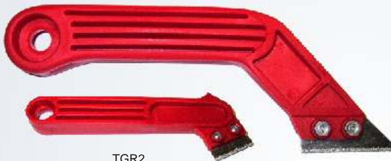
TGR2 TGR1 Fugenwerkzeug