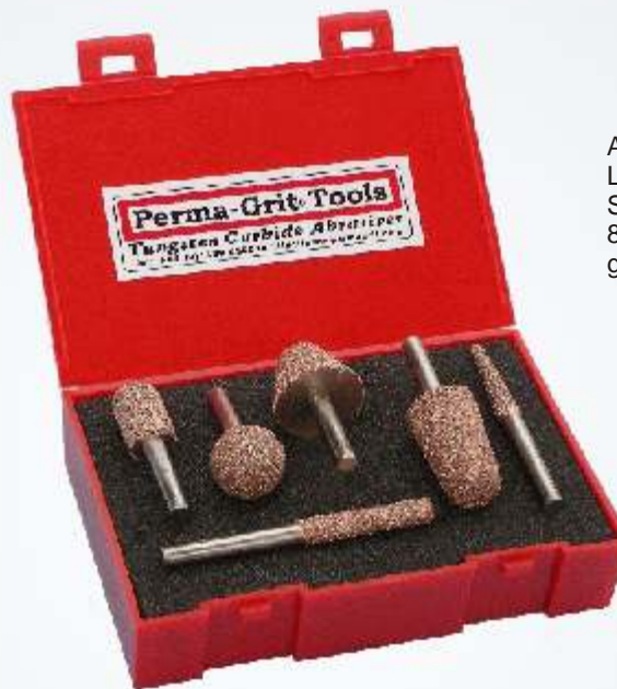
Art.-Nr. 219823-KT3 Satz Schleifstifte groß beinhaltet LR1C - LR6C