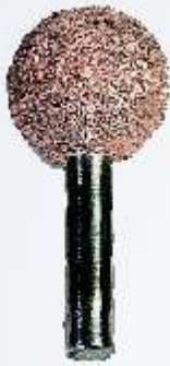
Art.-Nr. 219752 LR4C Kugel 20 mm grobe Körnung