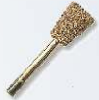
RF-7 seitenverkehrter Konus 10 mm Art.-Nr. 219786 grobe Körnung Art.-Nr. 219787 feine Körnung