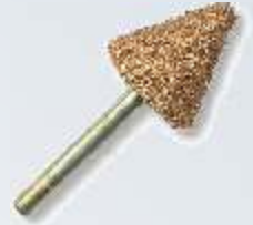
RF-2 Großer Konus 16 mm Art.-Nr. 219776 grobe Körnung Art.-Nr. 219777 feine Körnung