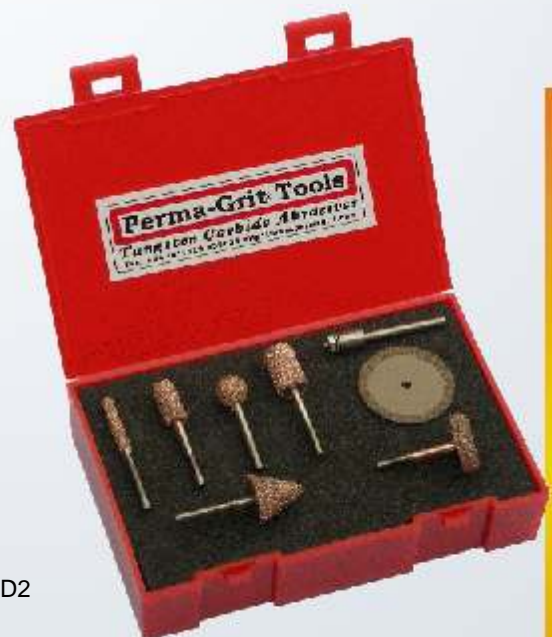
Art.-Nr. 219821-KT1 Satz Schleifstifte mit Trennscheibe RF-2C, RF-3C, RF-4C, RF-5C, RF-6C, RF-8C & RD2 32 mm