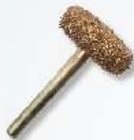
RF-4 Scheibe 20 mm Art.-Nr. 219780 grobe Körnung Art.-Nr. 219781 feine Körnung