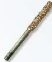
RF-6 Stift 4 mm Art.-Nr. 219784 grobe Körnung Art.-Nr. 219785 feine Körnung