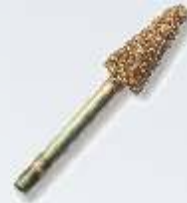
RF-1 Kleiner Konus 8 mm Art.-Nr. 219774 grobe Körnung Art.-Nr. 219775 feine Körnung

PERMAGRIT Schleifstifte werden mit einem 3 mm Schaft geliefert und sind in einer feinen (ca. 320) und einer groben (ca. 180) Ausführung erhältlich (ausgenommen RF9 und Rf10 die nur in fein bzw. ultrafein erhältlich sind). Alle Schleifstifte können mit Mini-Bohrmaschinen (wie Dremel od. Ähnlich) bei langsamer oder mittlerer Drehgeschwindigkeit eingesetzt werden.