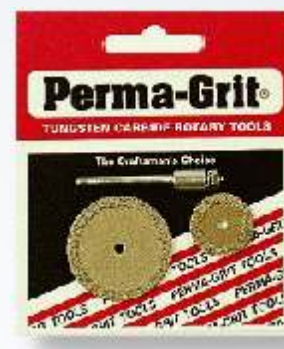
Art.-Nr. 219818-RD3 Trennscheibe 19 mm + 32 mm 3 mm Schaft + Mutter