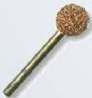
RF-8 Kugel 10 mm Art.-Nr. 219788 grobe Körnung Art.-Nr. 219789 feine Körnung