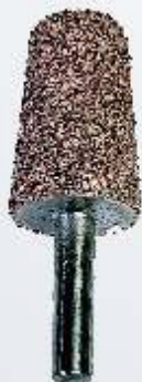
Art.-Nr. 219754 LR6C großer Kegel 20 mm grobe Körnung