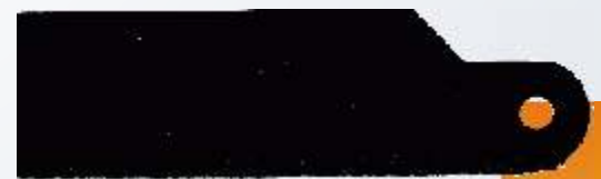
Art.-Nr. 219729 HS12 305 mm Metallsägeblatt