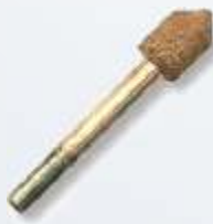
Art.-Nr. 219790 RF-9 kleiner Spitzsenker 90° 7 mm ultrafeine Körnung