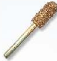
RF-5 Dome 7 mm Art.-Nr. 219782 grobe Körnung Art.-Nr. 219783 feine Körnung